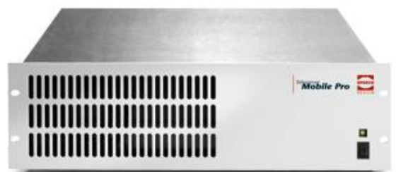
Tausendfach bewährte Technik